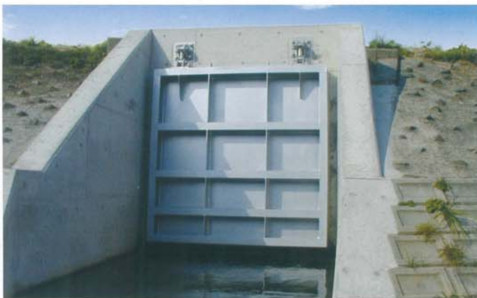
▲耐食アルミ合金製招扉／広島県東広島市西条大坪町